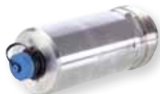
Moduł bariery iskrobezpiecznej Umożliwia podłączenie do detektora IRmax zdalnego wyświetlacza IR Display lub kalibratora