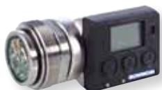
Moduł stacjonarnego wyświetlacza IR Display